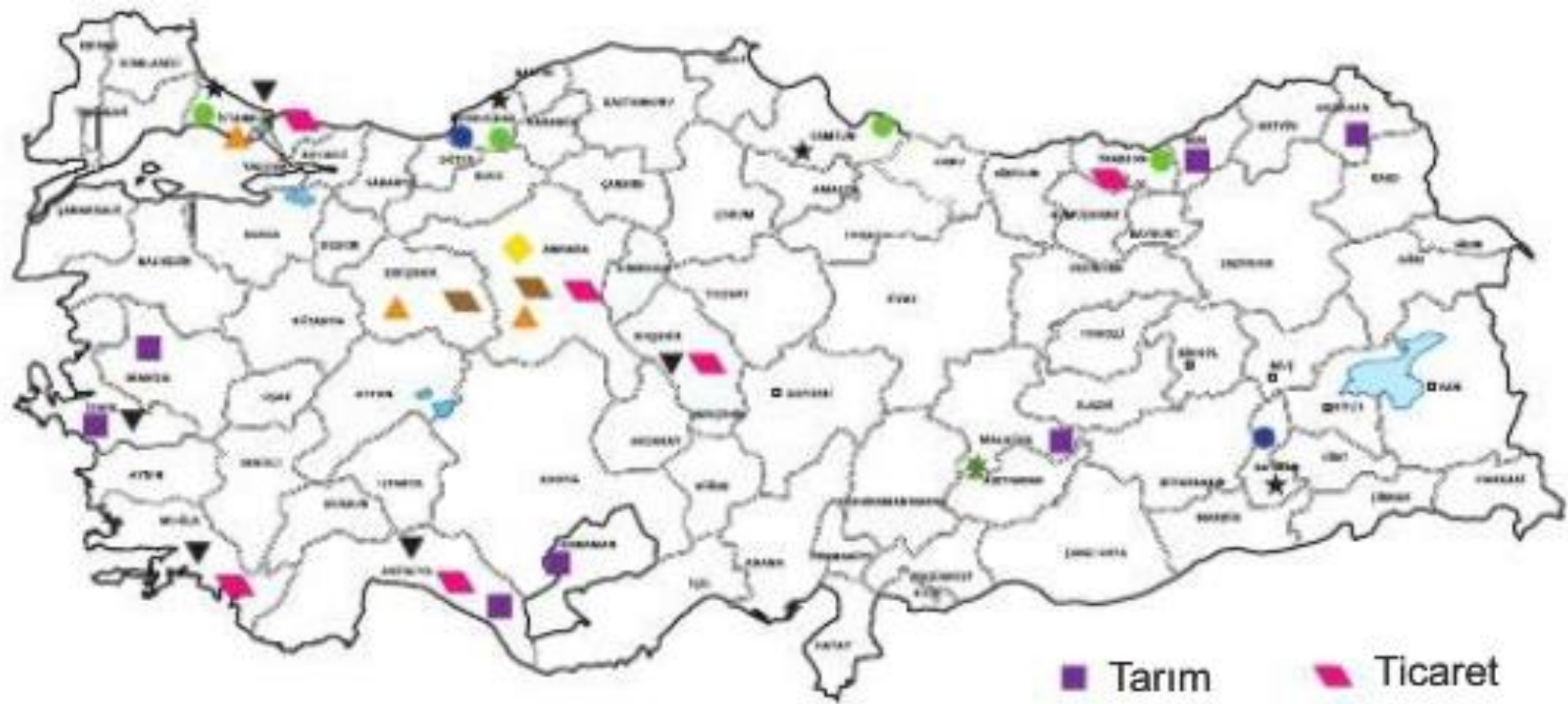
Türkiye'de bazı şehirlerin fonksiyonel özellikleri